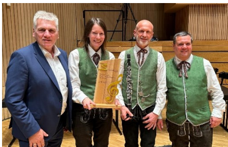
Musikverein Grünbach Bundessieger