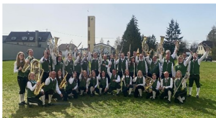
Musikverein Grünbach Landessieger