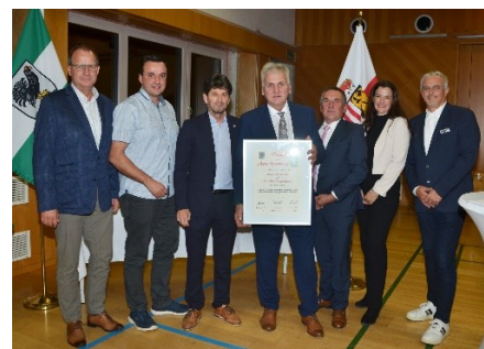
10 Jahre Bürgermeister