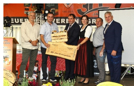
25 Jahre - Partnerschaftsfeier in Grünbach im Vogtland